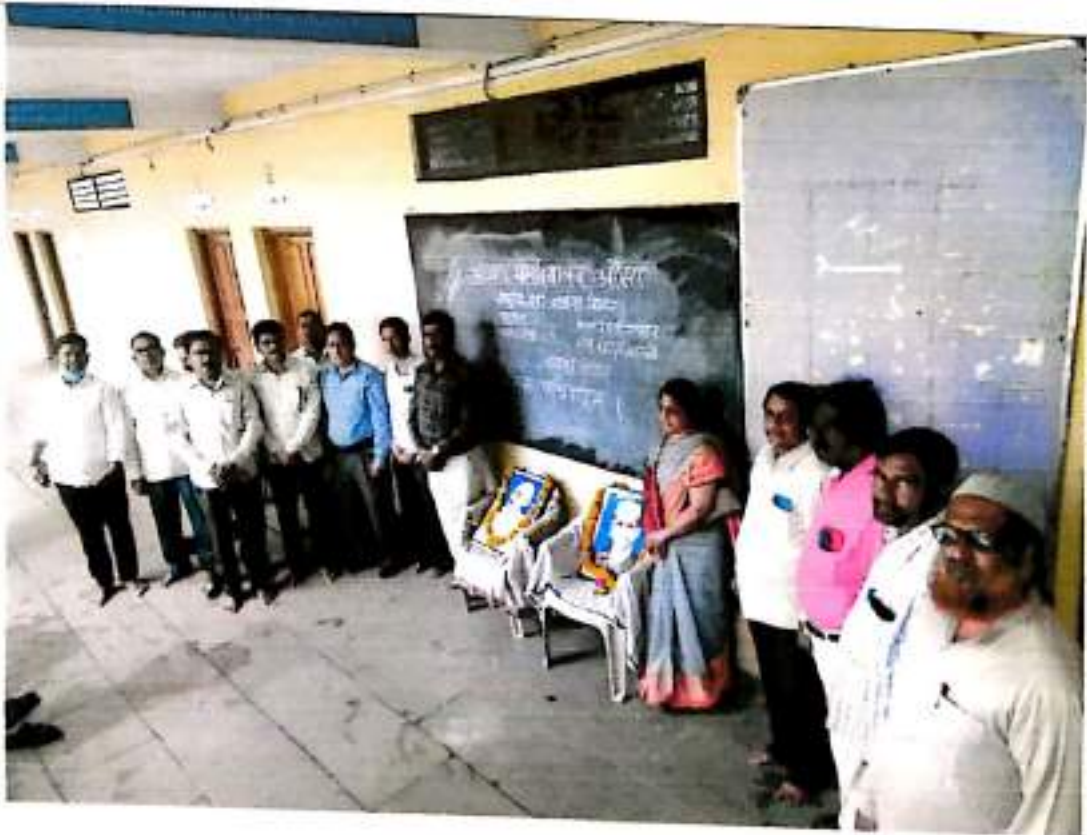
2/10/2021 म. गांधी व लाल बहादुर शास्त्री कार्यक्रम