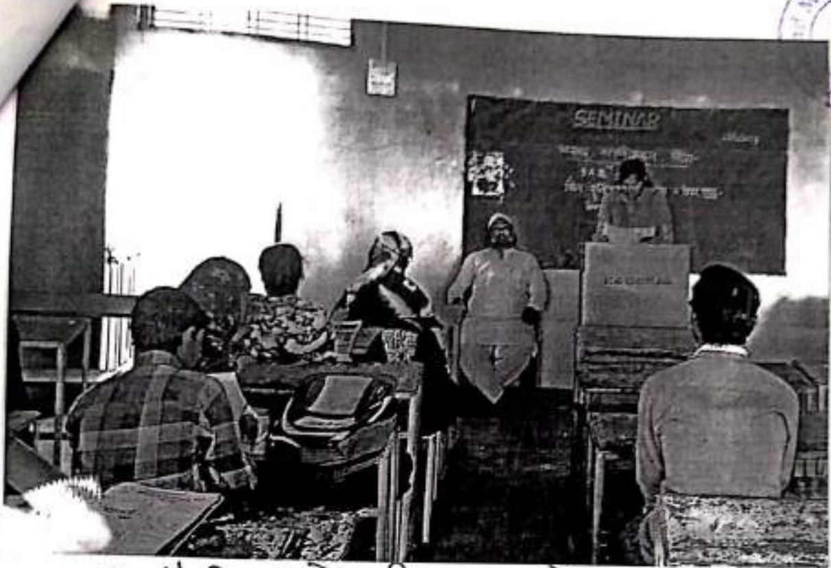
कु औटी शोपेश्वरी भाऊलारेव (BAII)