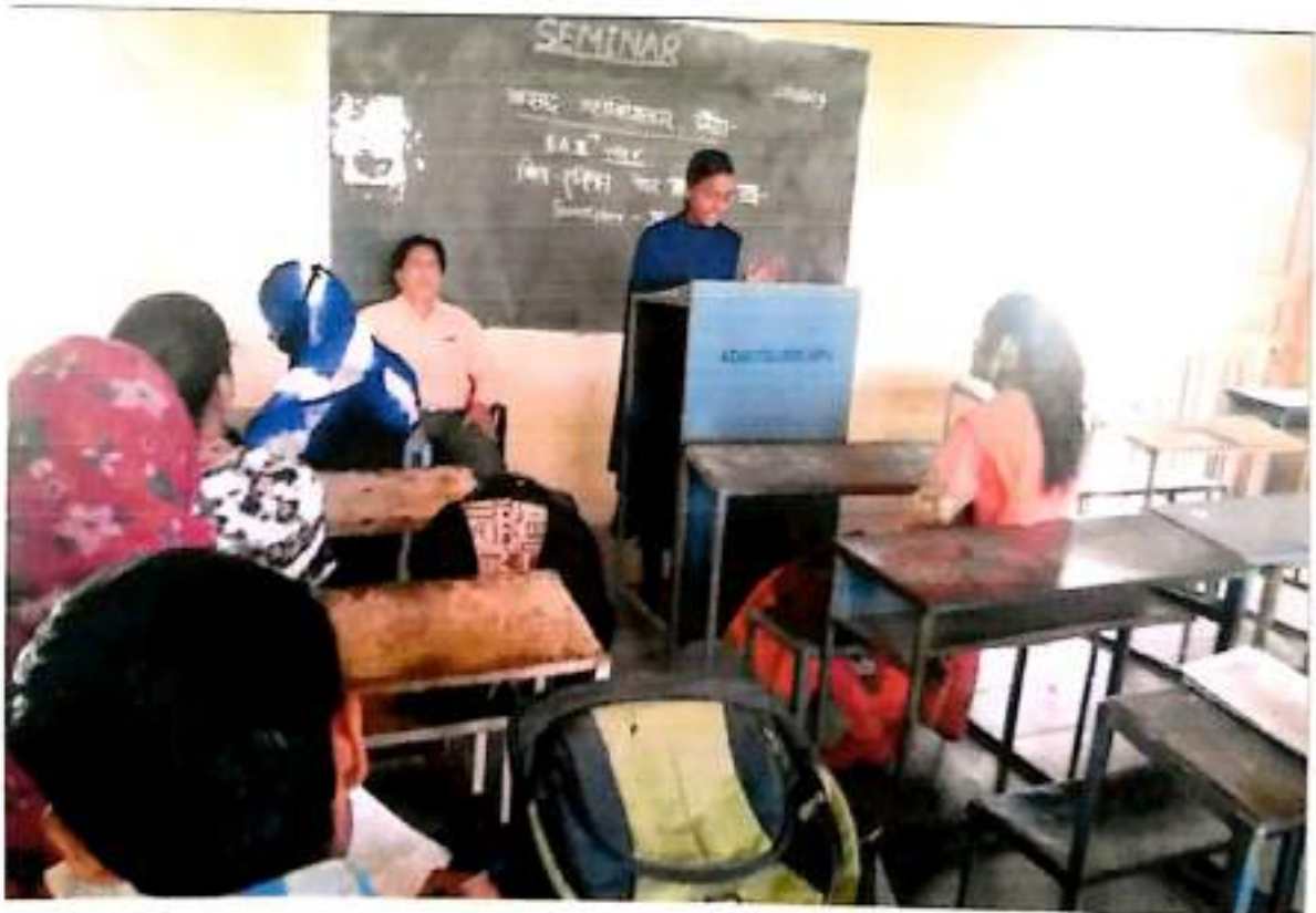
कु शेख हिन। रसूल