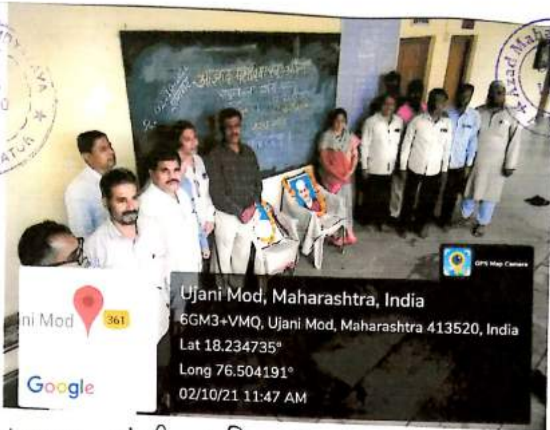
2/10/2021 गांधी जयंती कार्यक्रम संपन्न